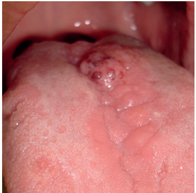
FIGURA 2. A mayor aumento se observan los límites difusos, superficie rugosa y puntillado violáceo