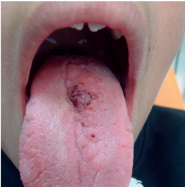
FIGURA 1. Inspección clínica de la lesión en el dorso lingual