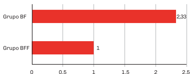
FIGURA 2. Dificultad de manipulación (escala de Likert)

analizaron mediante las pruebas Chi 2 y t-test, según lo que correspondía (nivel de significancia 0,05).