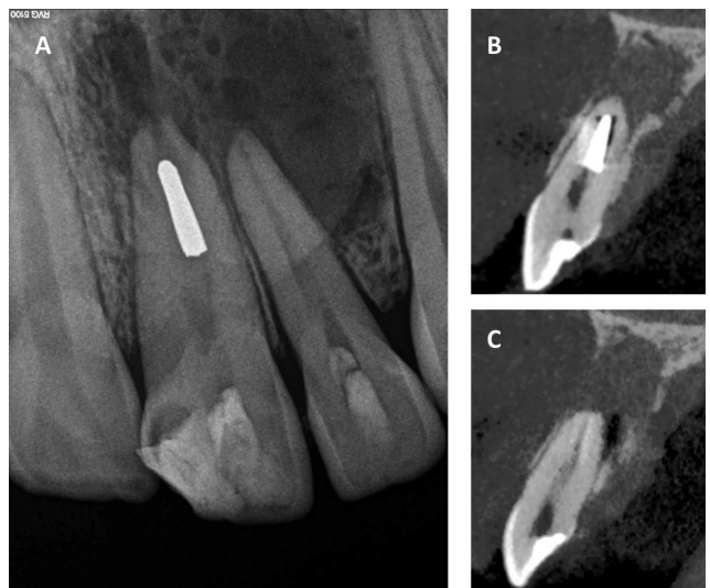
FIGURA 1. A. Radiografía periapical preoperatoria. B. Tomografía cone-beam, corte sagital de la pieza 2.1. En la pieza 2.1 se identifica el instrumento endodóntico localizado en el conducto como imagen radiopaca. C. Tomografía cone-beam, corte sagital de la pieza 2.2.

Luego de explicarle el plan de tratamiento a los padres de la paciente y de la autorización para la atención con el consentimiento informado, se comenzó con la terapia propuesta. Para comenzar con la atención, se le solicitó a la paciente que realice un enjuague para lograr la antisepsia bucal con 10 mL de