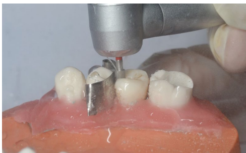
FIGURA 2. Tallado de PPO (dos por cada pieza dentaria).