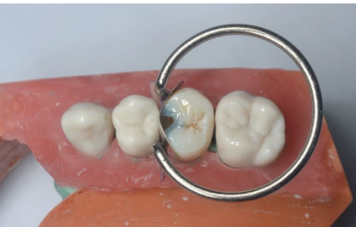
FIGURA 5. Grabado selectivo del esmalte.