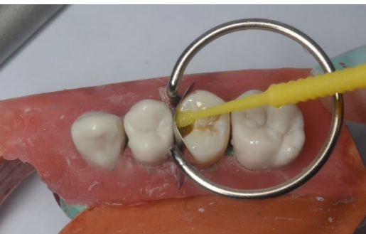
FIGURA 6. Tratamiento del sustrato dentario con el sistema adhesivo universal Single Bond Universal 3M.