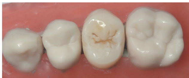
FIGURA 1. Piezas dentarias colocadas y fijadas en la arcada para simular las condiciones clínicas.

Se seleccionaron 9 premolares humanos sanos extraídos por razones ortodóncicas. Los criterios de inclusión fueron: que no posean caries coronales y que la corona este íntegra. Se fijaron las piezas dentarias con compuesto de modelar en un modelo plástico, con piezas dentarias vecinas, para simular la disposición espacial del arco dentario. (Figura 1). Se tallaron dos PPO por cada pieza dentaria, una mesial y una distal, (n=18) de 3 mm de profundidad por 3 mm de ancho, con piedra 845kr iso 026 de grano medio y fino, bajo refrigeración acuosa. (Figura 2) Para realizar cada preparación se utilizó una piedra de un solo uso (Figura 3). Se utilizaron