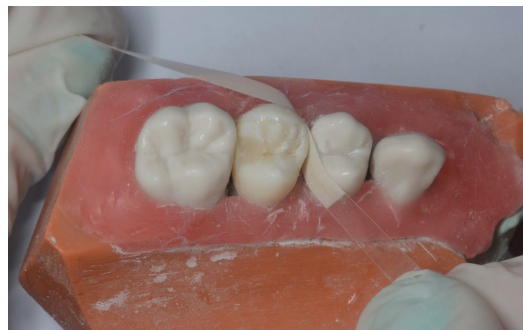
FIGURA 8. Retiro de excesos y pulido de las restauraciones.