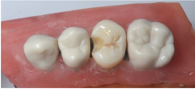
FIGURA 3. Preparación terminada.