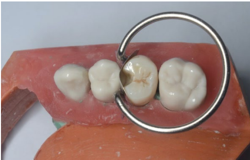
FIGURA 4. Matriz seccional de acero Unimatrix empleada en el estudio.