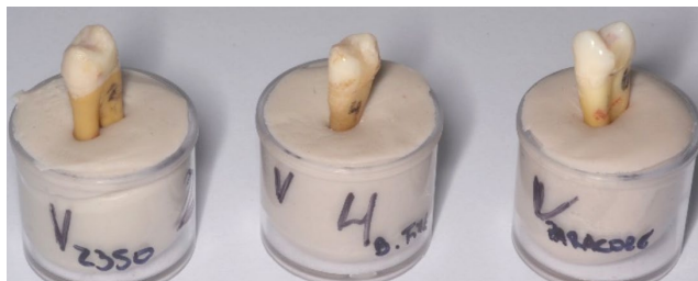
FIGURA 9. Piezas intactas extraídas del modelo y fijadas en silicona para inmovilizarlas.