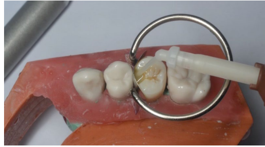
FIGURA 7. Grupo III: ParaCore (Coltene) en un solo incremento.