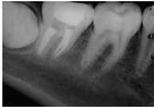
FIGURA 3. Radiografía posoperatoria inmediata

La introducción del MTA, como un material novedoso, permitió la realización de la técnica de apexificación con demostrada biocompatibilidad y buena capacidad de sellado (Torabinejad y Parirokh, 2010). Este material induce la formación de nuevo cemento y ligamento periodontal, proporcionando grandes ventajas con respecto a la técnica utilizada con anterioridad (Bakland y Andreasen, 2012). Como se mencionó previamente, el tiempo prolongado de fraguado es una desventaja de este material. Con referencia a esto, VanderWeele et al., (2006) sugieren que para disminuir la posibilidad de desadaptación del MTA luego de su colocación, debe mantenerse intacto durante, como mínimo 72 horas. Un estudio ex vivo concluye que hay diferencia significativa en cuanto a la microfiltración apical, comparando cuando se realizó la obturación inmediata a la colocación de MTA y cuando la misma se dilató 24 horas con el objetivo de esperar el tiempo de fraguado del MTA. Se sugiere entonces que lo indicado luego del sellado con MTA, sería dilatar la obturación final en otra sesión (Yazdizadeh et al., 2013).